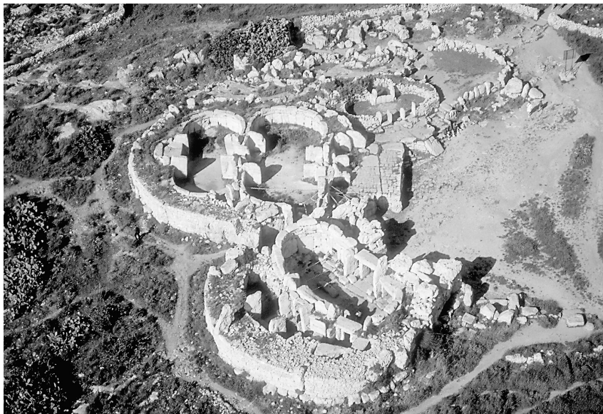
Abb. 1 Mnajdra (Malta), neolithischer Tempelkomplex des 4. Jt.s v. Chr.

Gruppen und ihrer Eliten waren. Sieht man von den Beziehungen innerhalb des großgriechischen Raumes ab, wurde allerdings das Ausmaß der Konnektivität, der Verbindungsdichte zwischen der Levante und Griechenland nicht erreicht. 14