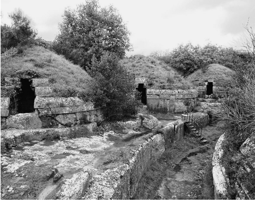
Abb. 3 Hügelgräber in der Banditaccia-Nekropole von Cerveteri/Caere, 6./5. Jh. v. Chr.

des siebten Jahrhunderts v. Chr. Dies setzte nicht nur Handelskontakte bis nach Spanien voraus. Voraussetzungen für diesen Austausch waren auch die enge Zusammenarbeit und die Lernprozesse von Handwerkern sowie die über die Region hinausreichende Orientierung der einheimischen Eliten und ihre Kommunikation mit den von außen kommenden kolonialen Eliten. Auch im Bereich des Religiösen ging es hier also um Interaktion, nicht bloß um Rezeption. 61